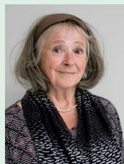
Mitzi Reinau Astma-Allergi Danmark